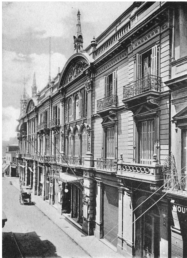
Entrada del Teatro Odeón. Buenos Aires

Continúa el columnista señalando las obras interpretadas y destacando el carácter de la interpretación que de las mismas hizo Landowska.