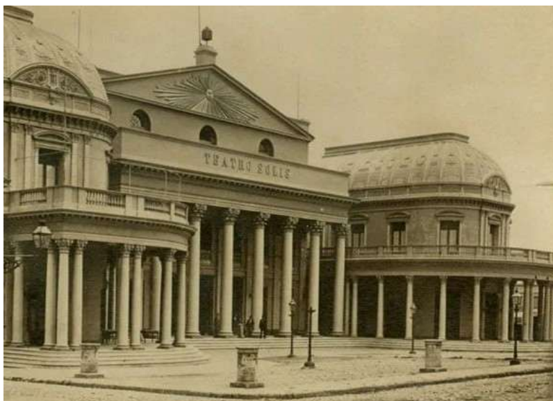
Teatro Solís de Montevideo.

Los primeros conciertos que anoté en la primera parte de mi investigación fueron los de Montevideo, en el Teatro Solís, que aún continúa como importante sala de conciertos.