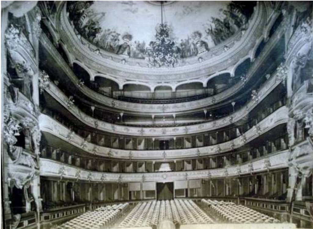
Interior del Teatro de la Ópera. Buenos Aires.

El cuarto concierto fue el que La Vanguardia anunciaba como probable, para el día 12 del corriente, junio, con José Iturbi. En realidad, fue el 9 de junio en el teatro de La Ópera (también hoy desaparecido).